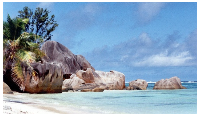
Anse Source d'Argent – La Digue