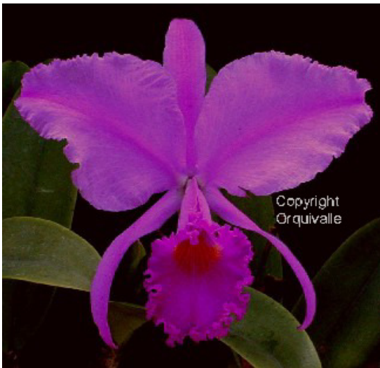
Cattleya trianae „Sangre de Toro“

Mangrovenwälder vor. Arten wie Cattleya dowiana aurea „Choco“ sind schwierig zu halten, da sie es sehr feucht mögen. Über die Bergkette der Anden hinaus, liegt das oft überflutete Magdalena-Tal. In diesem Landstreifen wird hauptsächlich Zuckerrohr angebaut; es wachsen Cattleya trianae „Sangre de Toro“ und die 5- bis 7-blütige Cattleya warszewiczii (früher gigas ) var. sanderiana , leicht an ihren beiden „Augen“ zu erkennen. Bei 1000 m im fruchtbaren Cauca-Tal ist es in diesem tropischen Trockenwald recht angenehm: dort wächst die stark duftende Cattleya quadricolor chocoensis . Auf 1500 m wird Kaffee angebaut. Der Nationalbaum Kolumbiens, die Wachs-Palme wächst auf 2000 m Höhe. Östlich im Orinoco-Becken findet man Cattleya schroederiana , eine duftende und sehr blühfreudige Pflanze. In der östlichen Kordillere auf über 2000 m Höhe wächst in dieser kühleren Region Cattleya mendelii . Zuletzt im feuchten Amazonas-Gebiet, an der Grenze zu Perú und Brasilien, finden wir eins der schönsten Schauspiele, welche die Natur uns bieten kann: die rosafarbenen Delfine (delfines rosados). In dem Gebiet wächst Cattleya rex , eine wegen ihres Feuchtigkeitsbedarfs schwer zu haltende Orchidee.